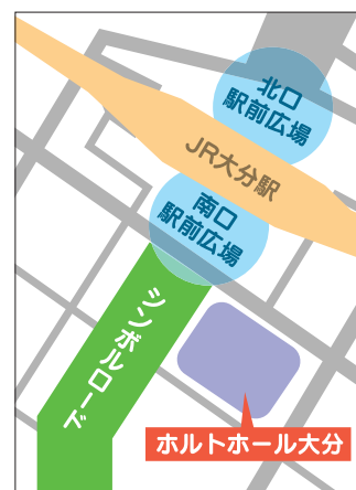
(主な講座会場) ホルトホール大分